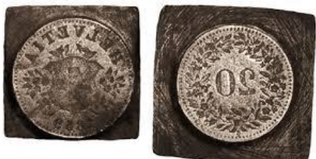
Les pièces de 20 centimes falsifiées par Farinet.

Farinet a également donné son nom à la plus petite et célèbre vigne cadastrée du Monde (1,68 m 2 ). Chaque année, des personnalités du sport, des arts viennent travailler ces quelques ceps, pour véhiculer encore longtemps la légende de ce Robin des Alpes.