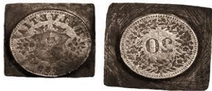
Die von Farinet gefälschten 20-Cent-Münzen.

Farinet hat auch seinen Namen der kleinsten und berühmtesten vermessenen Weinparzelle der Welt gegeben (1,68 m 2 ). Jedes Jahr kommen Persönlichkeiten aus Sport und Kunst, um diese wenigen Rebstöcke zu pflegen und die Legende dieses Robin der Alpen noch lange weiterzutragen.